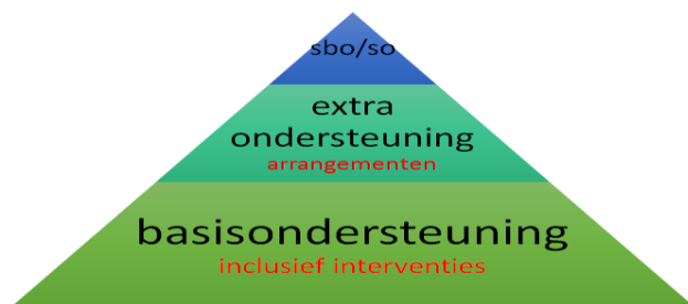
Fig. 11. Drie niveaus van ondersteuning

In het samenwerkingsverband onderscheiden we drie niveaus van ondersteuning. Elke leerling krijgt de ondersteuning die voor haar of hem passend is. We evalueren regelmatig of een leerling nog de juiste ondersteuning krijgt. Als er meer of minder ondersteuning nodig is, dan passen we het ondersteuningsniveau aan.